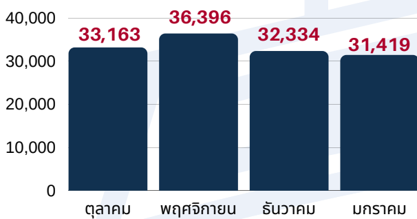
2 จำนวนการนำร่องเรือ